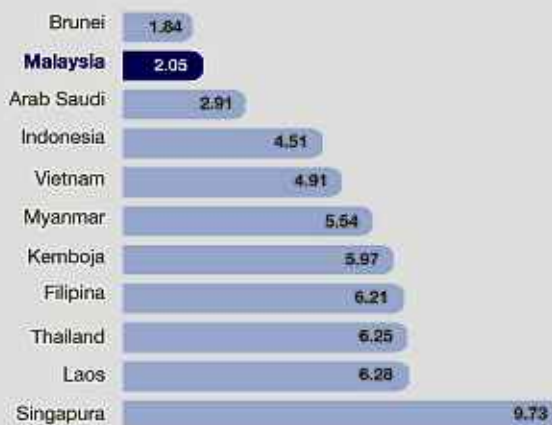
Rajah 2: Harga petrol berbanding negara lain RM/Liter (dikemas kini pada September 2023)

Matlamatnya mestilah untuk meringankan beban rakyat. Lebih penting lagi ialah membebaskan rakyat daripada belunggu kemiskinan dan pada masa sama menyediakan jaringan keselamatan sosial tanpa menjejaskan maruah mereka. Akhirnya, agenda lebih besar ialah membantu rakyat memperbaiki kehidupan melalui penyediaan pelbagai peluang bagi membolehkan mereka mengoptimalkan potensi masing-masing.