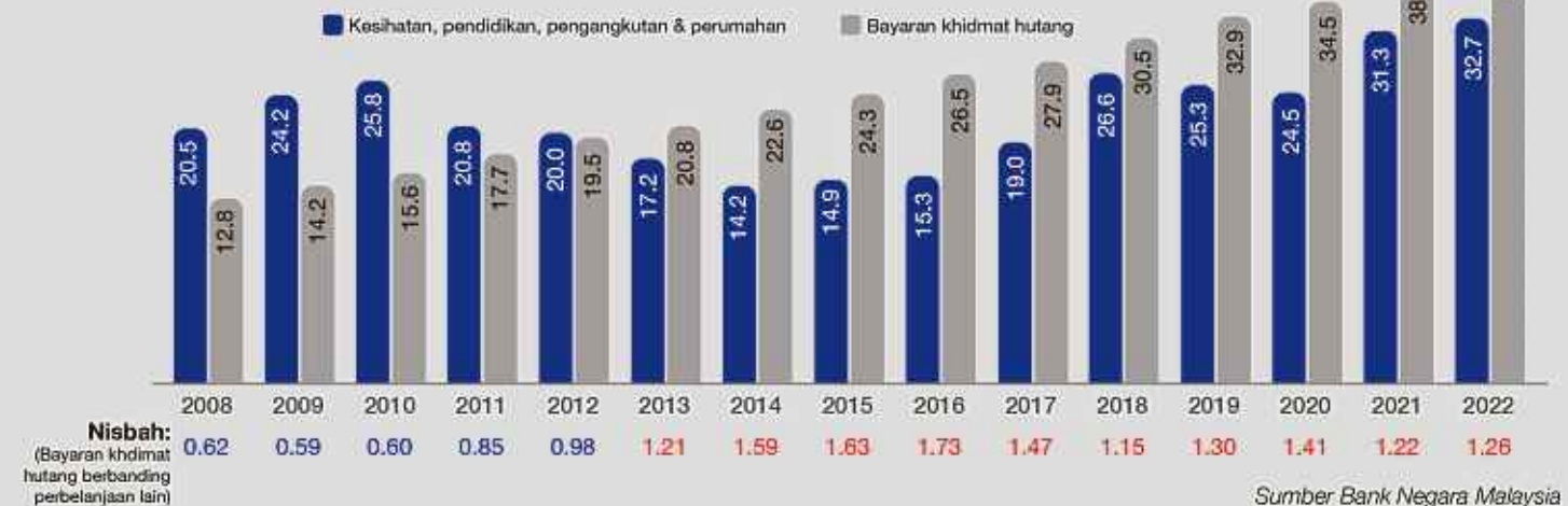
Rajah 1: Komponen Perbelanjaan Pembangunan Terpilih berbanding Bayaran Khidmat Hutang RM billion